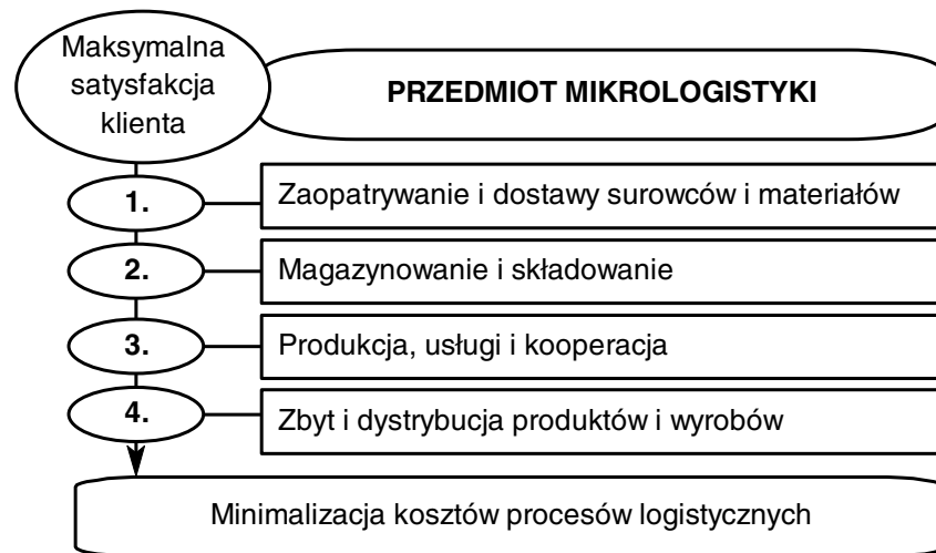
Rys.1.10. Obszary zainteresowań mikrologistyki