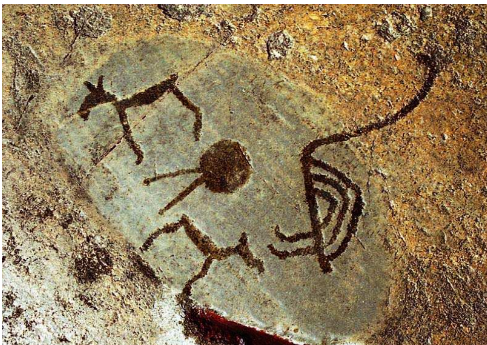
Ryc. 1. Petroglif karelski.

Źródło: Искусство предков. Петроглифы Карелии и Кольского полуострова . Portal: „Веси”.