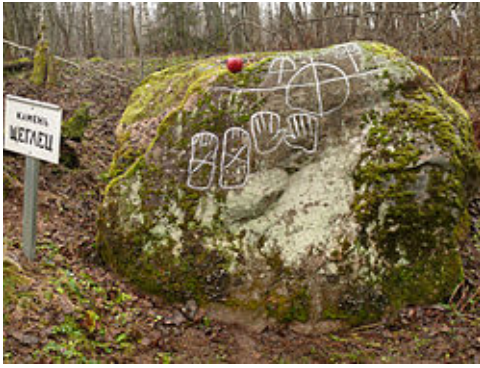
Ryc. 3. Głaz kultowy Щеглец .